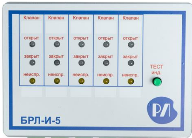
Рис. 1 Панель индикации блока БРЛ-И-5