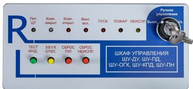
Рис. 1 Панель индикации и управления блока БРЛ-У-2